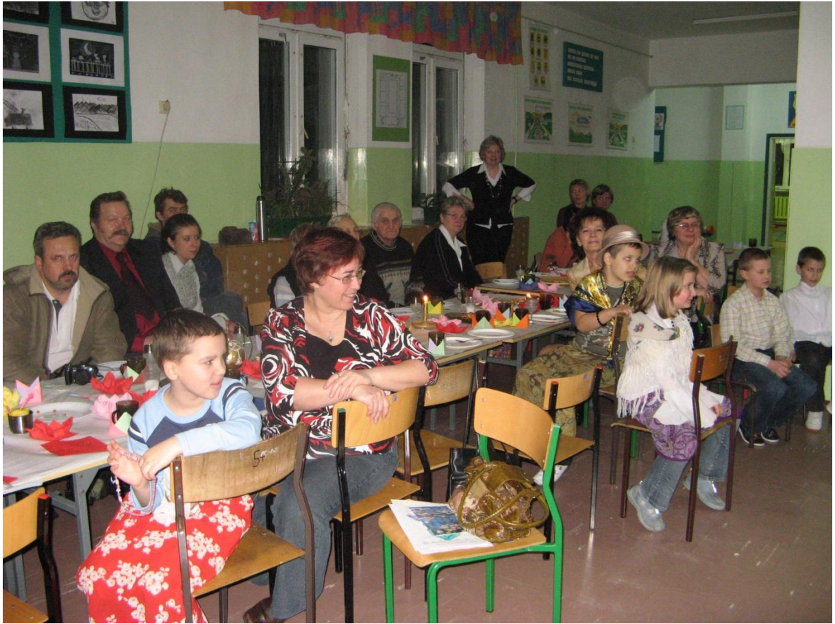
Opracowała - Wiesława Jurewicz